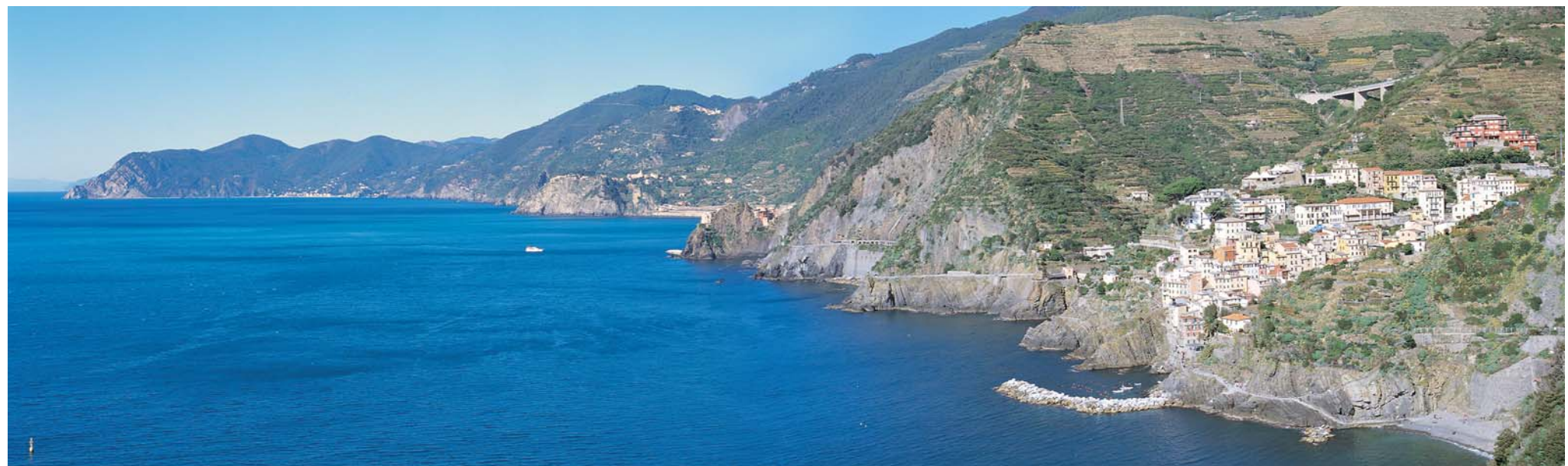
Le Cinque Terre, in primo piano Riomaggiore